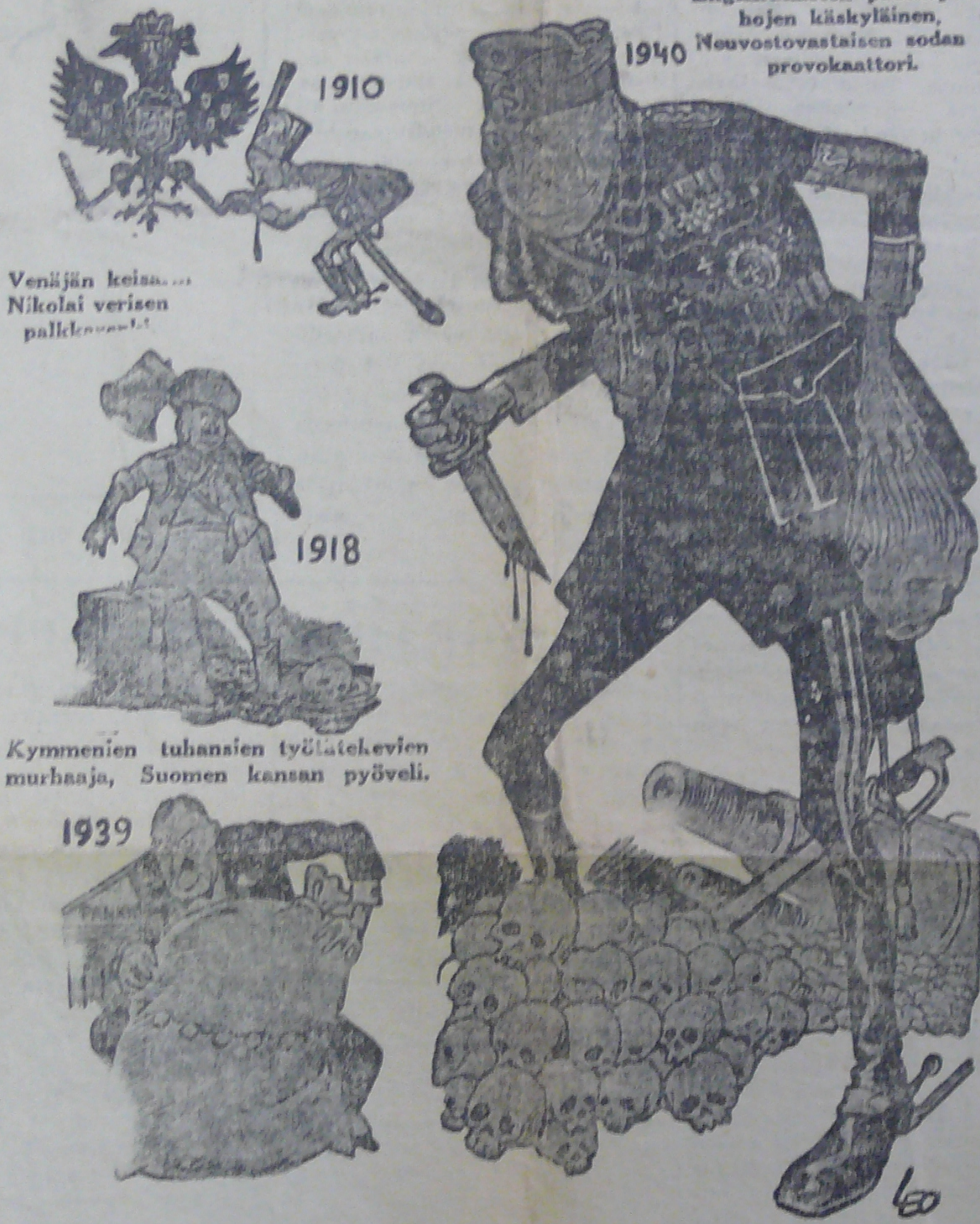
Venäjän keisari... Nikolai verisen palkkaneuvoston jäsen.

Englantilaisten pankkiporojen käskyläinen, Neuvostovastaisen sodan provokaattori.