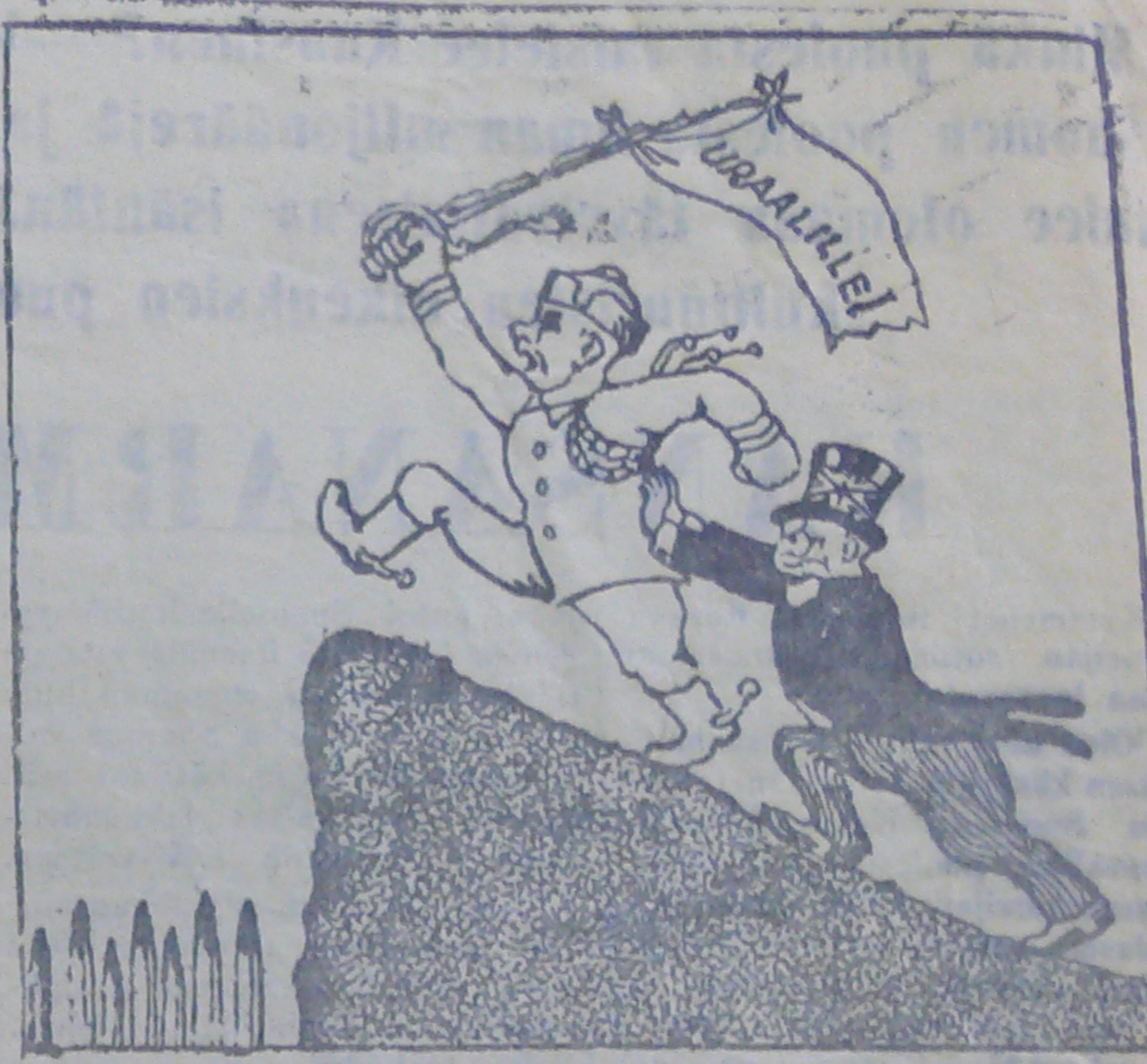
Valkosuomalaisten valloitus suunnitelmat.

selvittäessään englantilais-ranskalaisen sanomalehdistön vaihejuttuja tekijä kirjoittaa: "Sen päämäärä on aivan selvä: — peittää liittolaisten täydellinen toimettomuus länsirintamalla ja voimistuttaa Suomen avustusta, pitäen sitä hyökkäysasemana Leningradia vastaan ja laajentaa sota pohjoiseen, muodostaen uuden rintaman Saksaa vastaan ja vetäen tähän sotaan Neuvostoliiton."