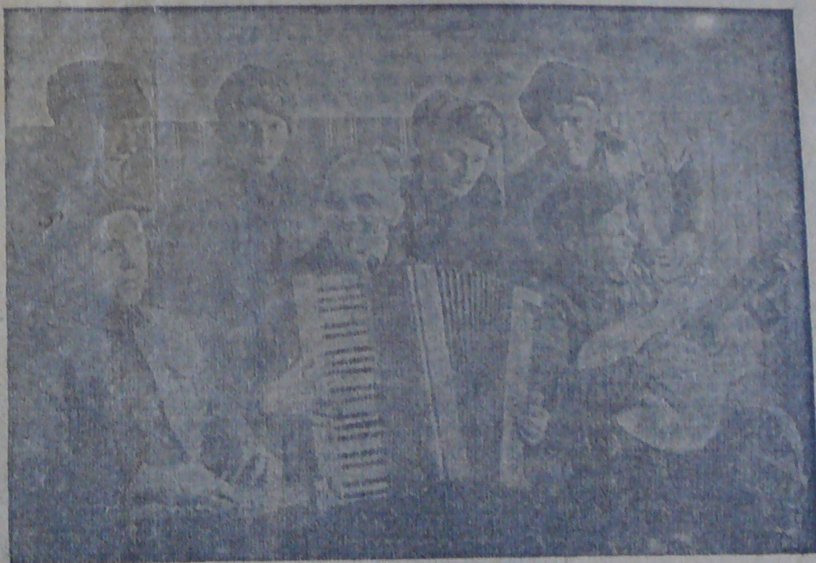
Sotavankeja soittamassa hanurilla, kanteleella ja kitaralla