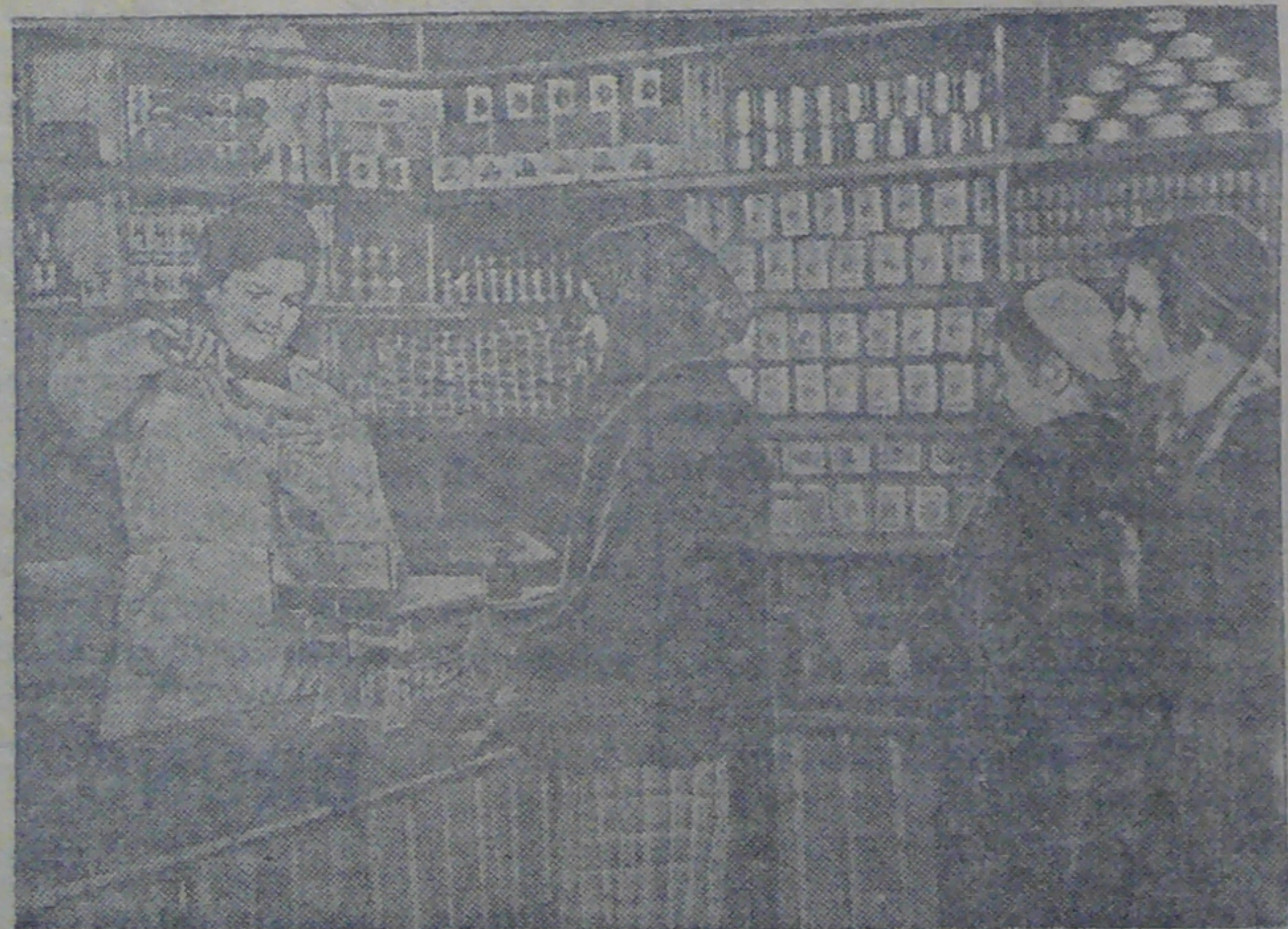
Ignoilan kylässä toimii uusi kauppa.

"viimeiseen hengenvetoon sälle, Suomen Kansanvaltaiselle Tasavallalle ja sen Kansanhallitukselle".