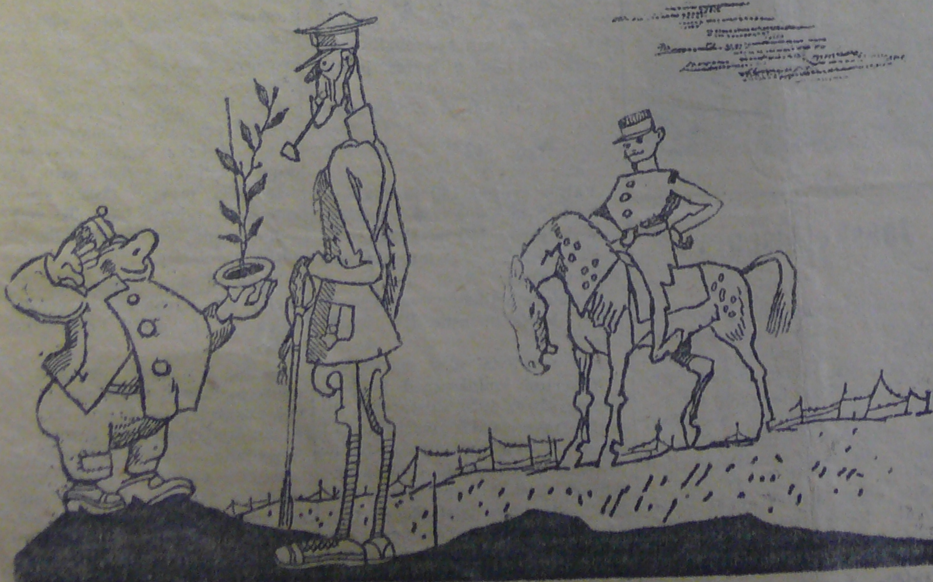
Länsillä rintamalla ei mitään uutta (lehdistä). Sallikkaa esittää saksalaisilta valloitettu alue.