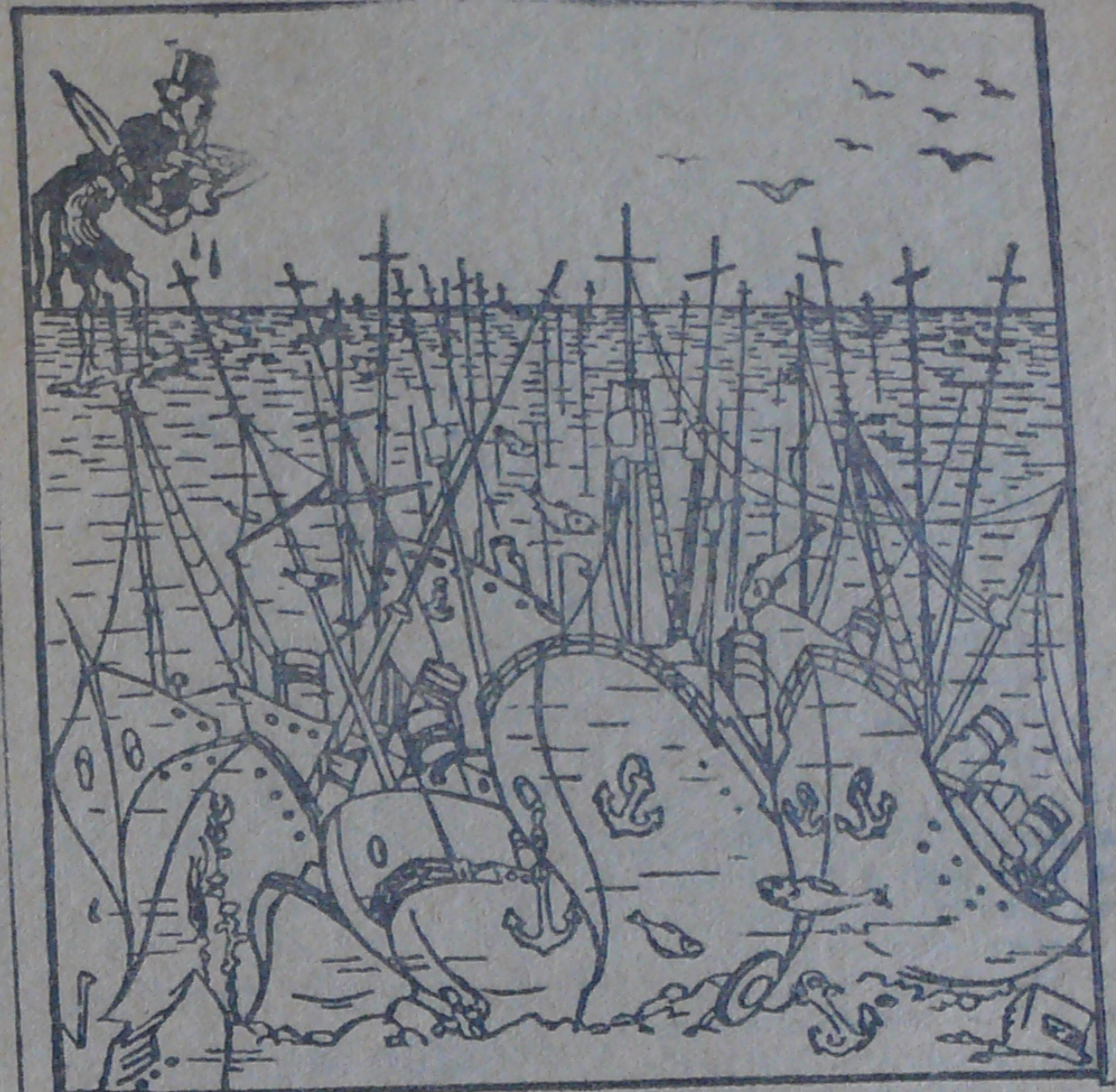
Mahtava Britannian vedenalainen laivasto