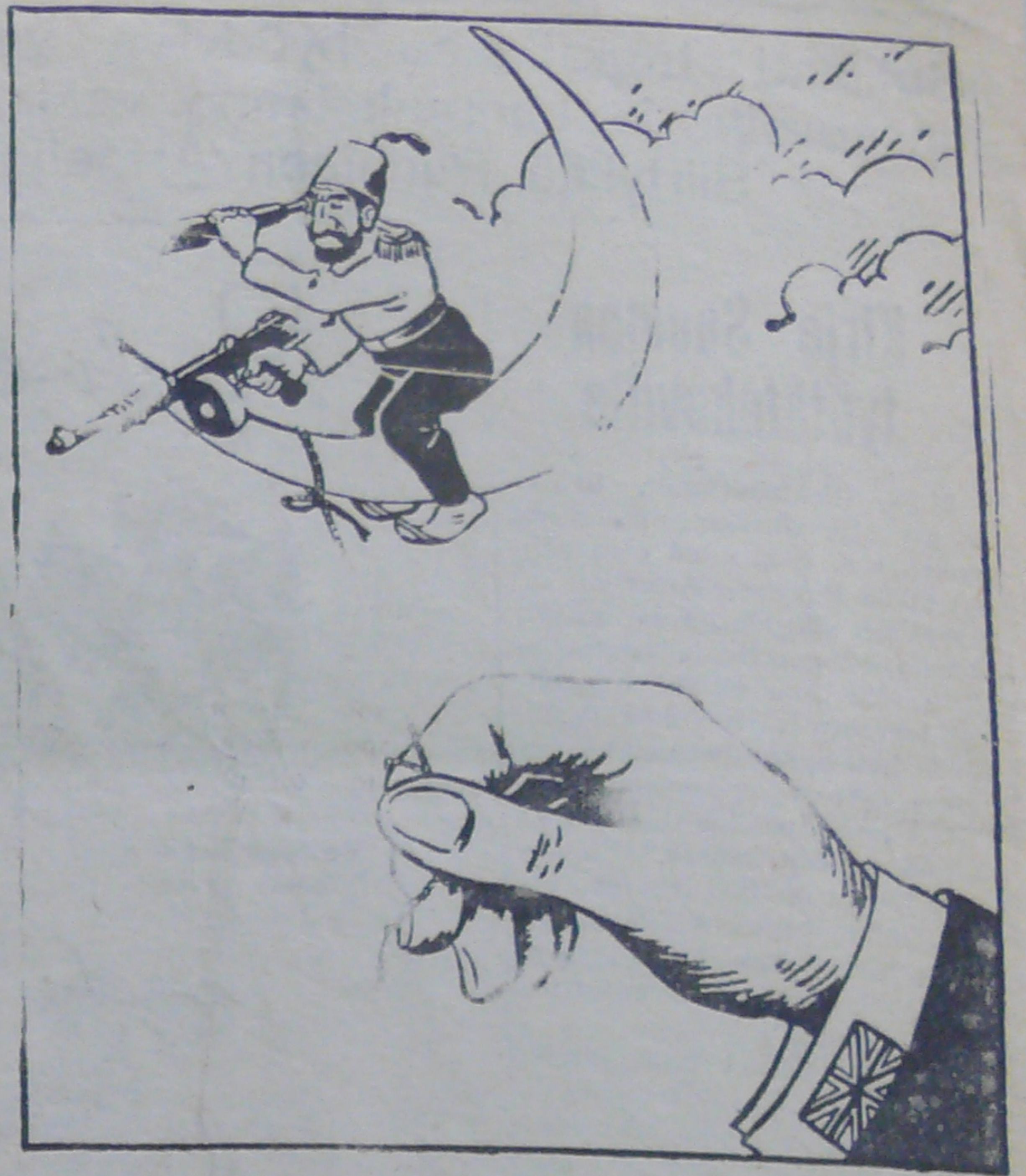
Turkin ottama kanta suhteessa Balkanin maihin.

Berlini. Artikkelissa "Saksan Voima ja britannialainen valhe" "Völkischer Beobachter" kirjoittaa: "Länsivaltiot eivät suostu saksalaisten vakuuttamiseen, että sodan ensimmäisellä vuosipuoliskolla he kadottivat 335 lentokonetta, kuin samanaikaisesti Saksa kadotti ainoastaan 78 lentokonetta. Tämän tunnustaminen Lontoossa ja Pariisissa on vaikeata, sillä siellä yritetään todistaa oman ilmailuvoimansa etevämyydestä. Pitemmän aikaa länsimaat tiedottivat britannialaisten lentokoneiden lennoista Berlinin yllä. On ihmeteltävää, miksei ainoakaan neljästä miljoonasta berliniläisestä ole nähnyt eikä kuullut ainoatakaan englantilaista lentokonetta. Me tiedämme, että nämä valheelliset tiedotukset ovat sodankäymisen epäonnistumisen tulos. Englanti keksii omia saavutuksia sen asemesta, että valtaisi niitä. Tulevaisuus tulee näyttämään mitä maksavat nämä lasten mielikuvitukset".