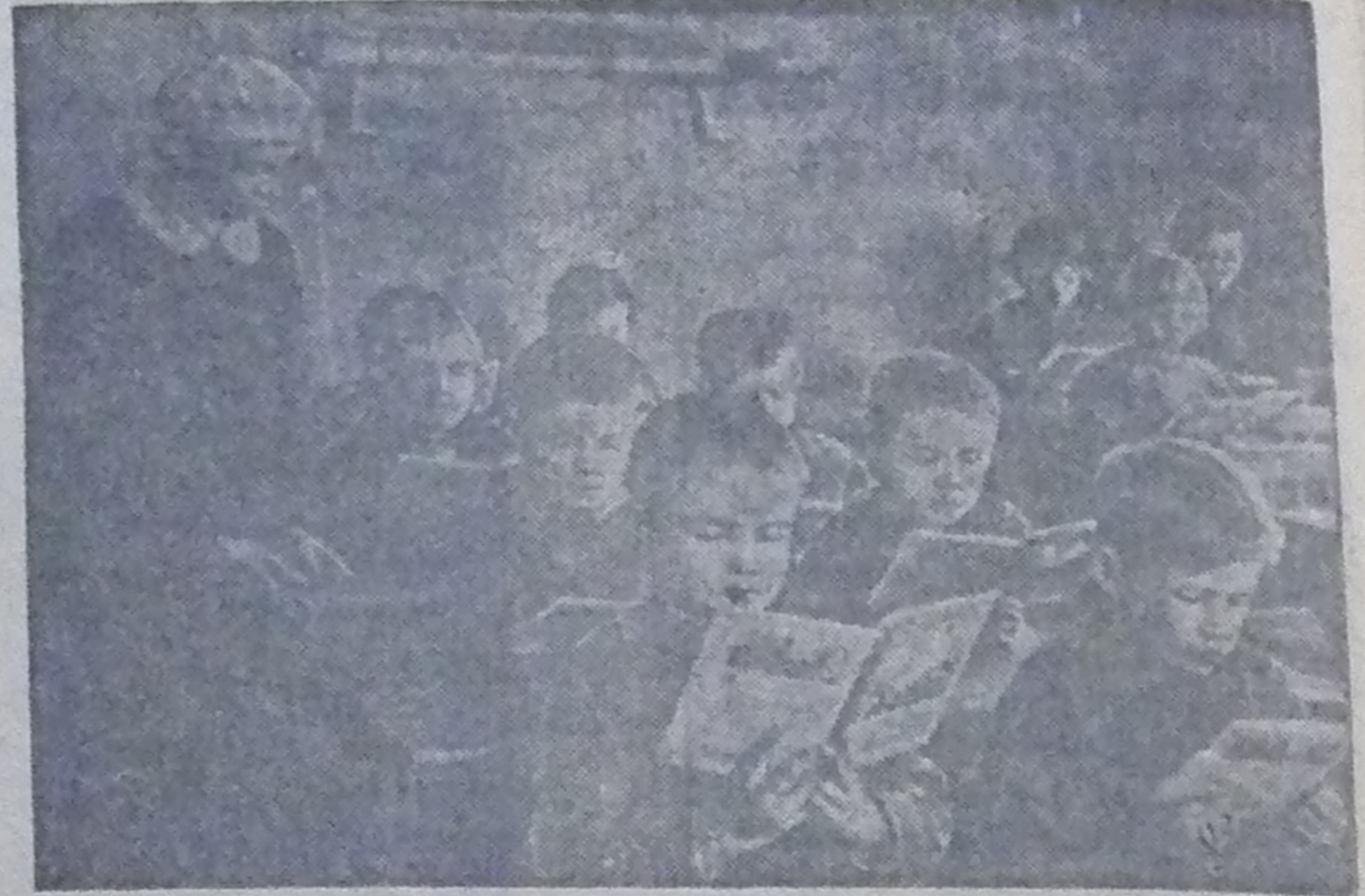
Ensimmäiset oppitunnit Ignoilan kylän koulussa.