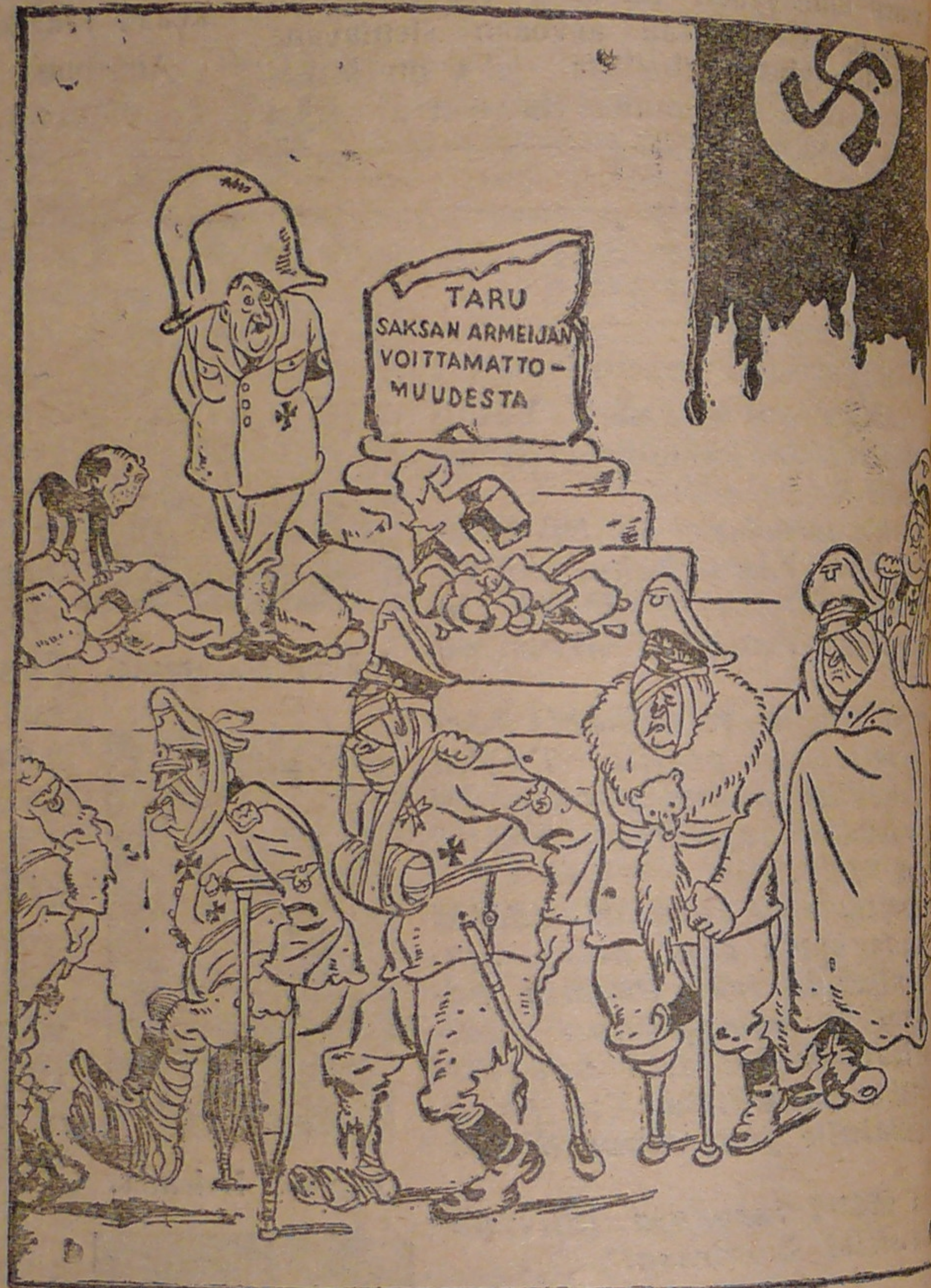
„Fyyreri“ ottaa vastaan selkäänsä saaneiden „voittamattomien“ kenraaliensa paraatin. Vasemmalta oikealle: Kleist, Schmidt, Strauss, Guderian ynnä seuraavat.

„Punainen armeija on hyvin organisoitu, varustettu ja sotaan harjaantunut armeija. Sen joukko-osastoja ja yhdistelmiä komentavat kyvykkäät päälliköt“.